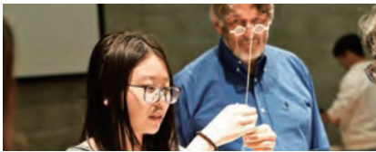
ケンブリッジ大学 STEAM サマーキャンプ イギリス・ケンブリッジ