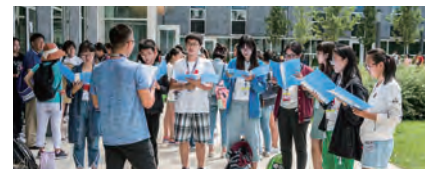
プリティッシュコロンビア大学 サマーキャンプ カナダ・プリティッシュコロンビア