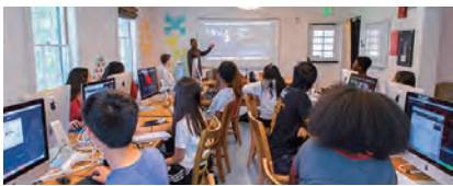
スタンフォード大学 STEAM サマーキャンプ アメリカ・カリフォルニア

ハワイ州観光局が推奨するボランティア活動への参加、ハワイの自然保護活動など、観光都市ハワイを SDGs の目線から多角的に探求し、深掘りする研修。ハワイ大学生案内による市内観光や現地校生との交流の機会も設ける。