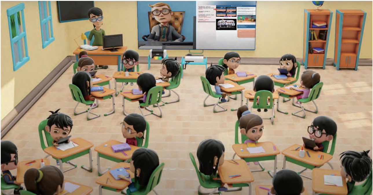
クラス別ライブ授業風景のイメージ