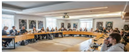
模擬国連プログラム スイス・ジュネーブ