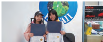
インターンシップ体験プログラム アメリカ・ハワイ