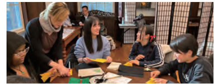
現地学校短期留学 カナダ/オーストラリア/ニュージーランド