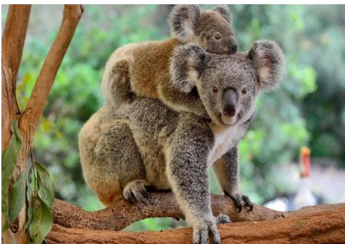
ローンパイン コアラサンクチュアリ