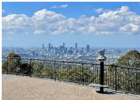
マウントクーサ展望台