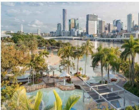
サウスバンク パークランズ

Griffith English Language Institute (GELI)のスタッフが引率します。