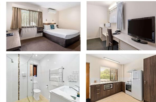
Quality Hotel Robertson Gardens イメージ写真